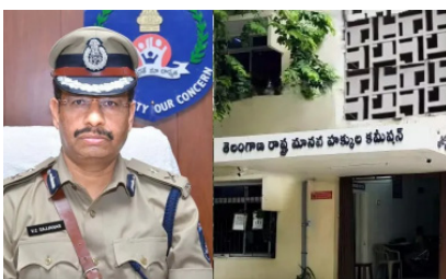
గౌంట్ కోసుకుపోయింది. దీంతో తీవ్ర రక్తప్రాపమైన ఏపీసీఎస్ వెంటనే ఆస్పత్రికి పంపించారు. చైనా మాంజా అమ్మినా.. కోసుకోలు చేసినా.. ఆ మాంజాతో పకంతులు ఎగతేసినవారైతేనే కేసులు పెడతామని పోలీసులు హెచ్చరిస్తున్నారు.

కాగా, నిషేధిత చైనా మాంజా సగరవాసుల ప్రాణాల మీదకు తెచ్చింది. వీటి వల్ల తరచూ ప్రమాదాలు జరుగుతున్నాయి. మనుషుల ప్రాణాలు పోతున్నాయి. కాగా తెలంగాణ, సంక్రాంతి పండుగ వేళ నిషేధిత చైనా మాంజా కాణింగా మరొకరు గాయపడ్డారు. ఉత్తర సస్పెన్షన్ పరిధిలో చైనా మాంజా తగలదంతో ఏపైపు నాగంజా